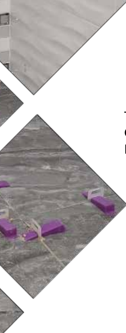
TABLA INDICANDO LA CANTIDAD DE ESPACIADORES / CUÑAS RECOMENDADOS POR M 2 SEGUN EL FORMATO DEL ENCHAPE